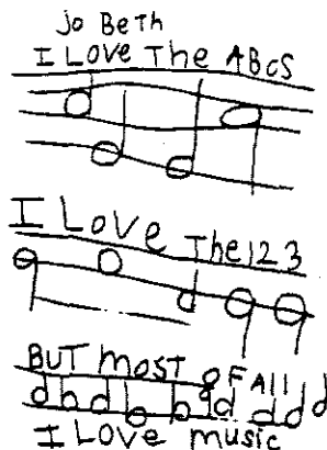
FIGURE 1 - JoBeth

Temple, C.A., Nathan, R.G., Temple, F., & Burris, N.A. (1993). The beginnings of writing. Needham Hgts, MA.. Allyn & Bacon