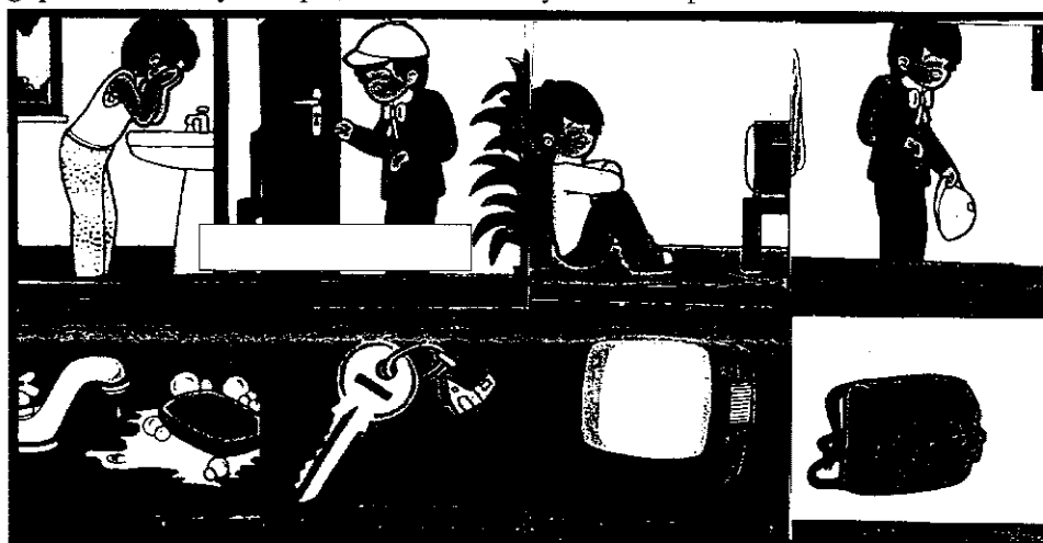
Tableau Introtalker. Associer action et objet